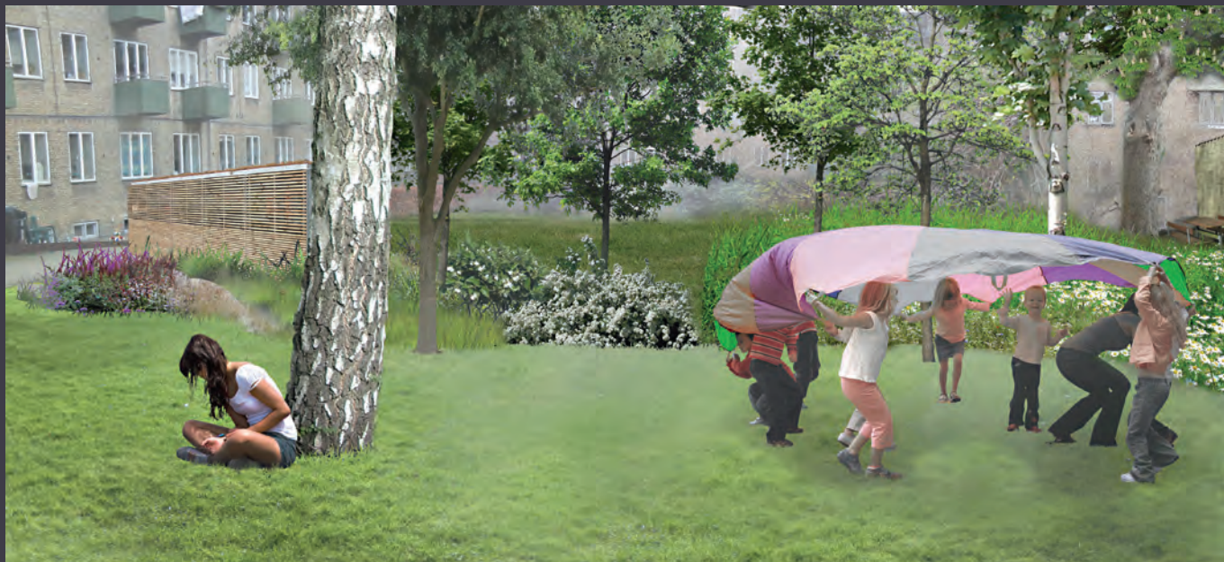
Fremtidig gårdhave ved ejerforeningen