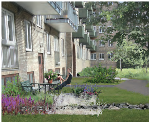
Fremtidig gårdhave ved andelsboligforeningen

Målet er at skabe en frodig, robust og bæredygtig bynatur. De grønne områder vil være varieret sammensat af græsområder, engarealer, dyrkningsbede, grønne vægge, bærbuske, frugttræer og mindre grupper af træer. Gårdhaven vil få et bredt udvalg af plantearter, der understøtter en høj biodiversitet. De gamle træer, der er særligt værdifulde for gårdens udtryk, rumlighed og samlede biodiversitet, bevares. Hvis det er muligt plantes eksisterende stauder om. Plantearterne udvælges, så de passer bedst muligt til de eksisterende og fremtidige forhold så som jordtype, fugtighed, lys og skygge.