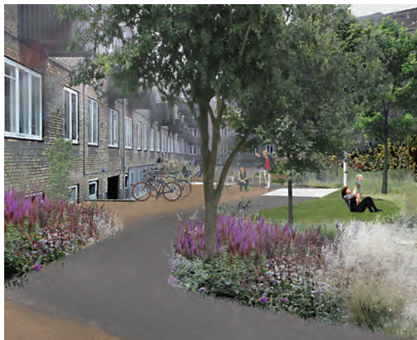
Fremtidig gårdhave ved ejerforeningen