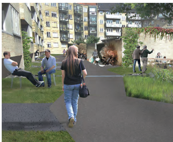
Fremtidig gårdhave ved udlejningsejendommen